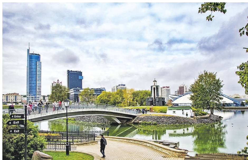
Один из уголков Минска.