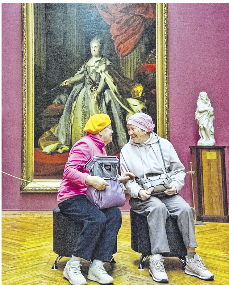
В Национальном художественном музее Беларуси.

Я была в Беларуси год назад, и впечатления, поначалу яркие, как щекастые помидоры на минском рынке «Восточный» или апельсиновые гиганты БелАЗы, теперь приобрели акварельную размытость белорусской нивы или скромного символа государства — полевого василька.