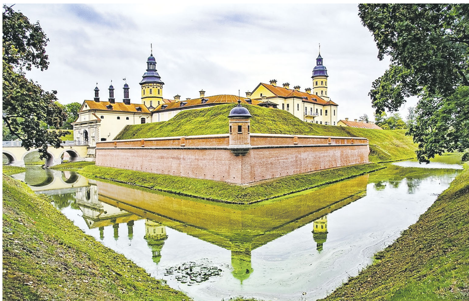
Мирский замок в Несвиже.