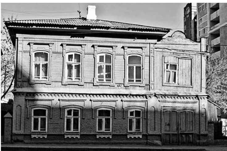
Здание больницы до сноса.