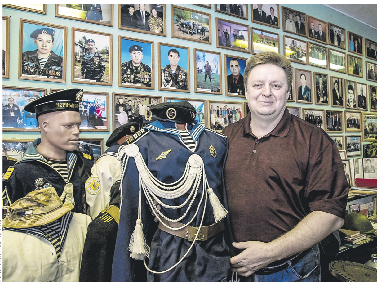
И «папа-активист», и увлеченный краевед.

А еще при непосредственном участии «папы-активиста» в Кандрах сформировался потрясающий музей боевой и трудовой славы. Он из тех му-