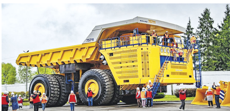
Самый большой в мире БелАЗ грузоподъемностью свыше 500 тонн.