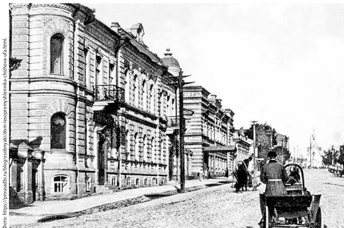
Особняк, где проживал купец, сохранился.