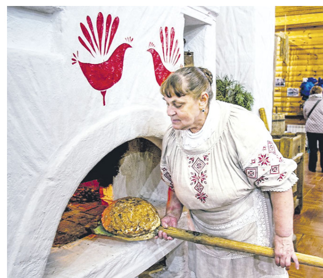
В музее старинных белорусских ремесел и технологий «Дудутки».