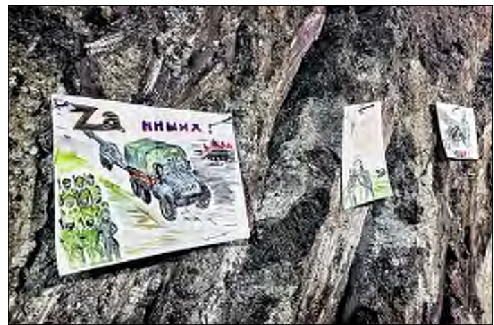
Картинная галерея в блиндаже греет душу.

20 105 лет со дня рождения Героя Советского Союза Закира Асфандиярова.