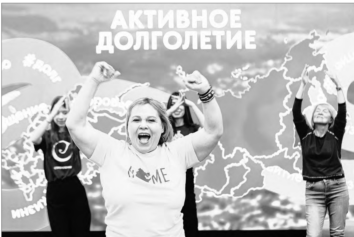
Выставка привлекла самых ярких представителей старшего поколения.

Башкортостан доказал на выставке-форуме «Россия», что у активного долголетия нет возрастных границ