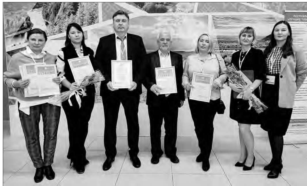
Победители конкурса «Сто лучших товаров России». // Фото предоставлено пресс-службой ПАО АНК «Башнефть».

Вообще, высокий уровень товаров, выпускаемых «Уфаоргсинтезом», итоги своеобразного смотра достижений промышленности показали очень наглядно. Ведь кроме СКЭПТ-Э