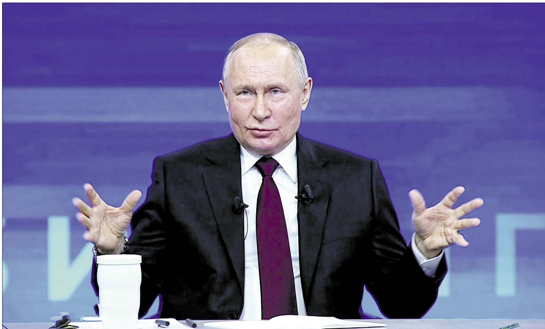
Чуть больше четырех часов отвечал на вопросы россиян Владимир Путин.