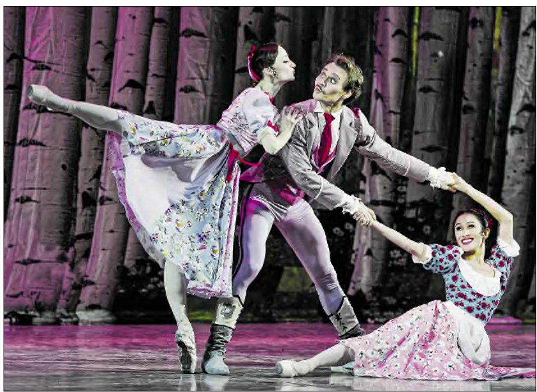
На сцене Башоперы «выросла» березовая роща.

«Две Лизы с разницей в 30 лет», — отмечает хореограф, который в новом спектакле усилил второстепенные роли и раскрыл их