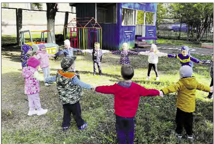
Детям нужна новая игровая зона.

— Инициативная группа вышла с предложением участвовать в программе для установки во дворе дошкольного учреждения игровых площадок, — го-