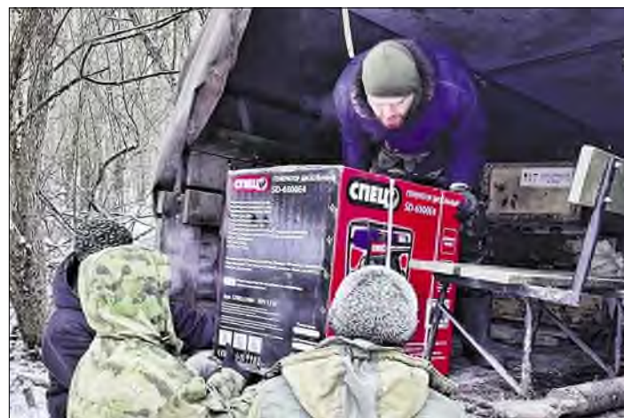
Генератор на передовой — вещь нужная.

Вместо навигатора у волонтеров список названий населенных пунктов. Справа указатели на русском, слева на украинском. Границей служит лесополоса. Из-за чего приключаются разные истории. Однажды дозорный ВСУ по старой памяти завернул в блиндаж, думая, что там свои. Но позицию к тому времени уже заняли российские пехотинцы. Увидев на пороге украинского бойца, они с матерком поинтересовались, типа, откуда ты, хлопчик, нарисовался такой красивый? Тот обреченно вздохнул: «Ребята, я очень голодный, дайте поесть перед пленом, потом давайте со мной что хотите». Врага накормили, потом уж оформили как положено.