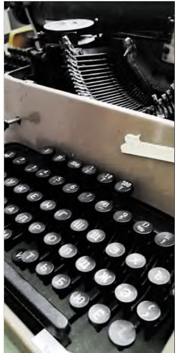
Печатная машинка сейчас — настоящий раритет.