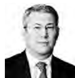
Ради́й ХАБИРОВ, глава Башкирии:

— Мы уже приняли решение: две тысячи наших ветеранов по программе «Башкирское долголетие» направим именно сюда, на ВДНХ. Первые 50 школьников из 2,5 тысячи по программе «Школьный туризм» здесь уже побывали. И мы продолжим их направлять — на канкулах и до завершения выставки «Россия» в апреле. Нужно привлечь как можно больше количество наших жителей, чтобы пришли и посмотрели на то, чем богата Россия. И получили бы эстетическое, интеллектуальное удовольствие и вообще порадовались тому, какая у нас великая и замечательная страна.