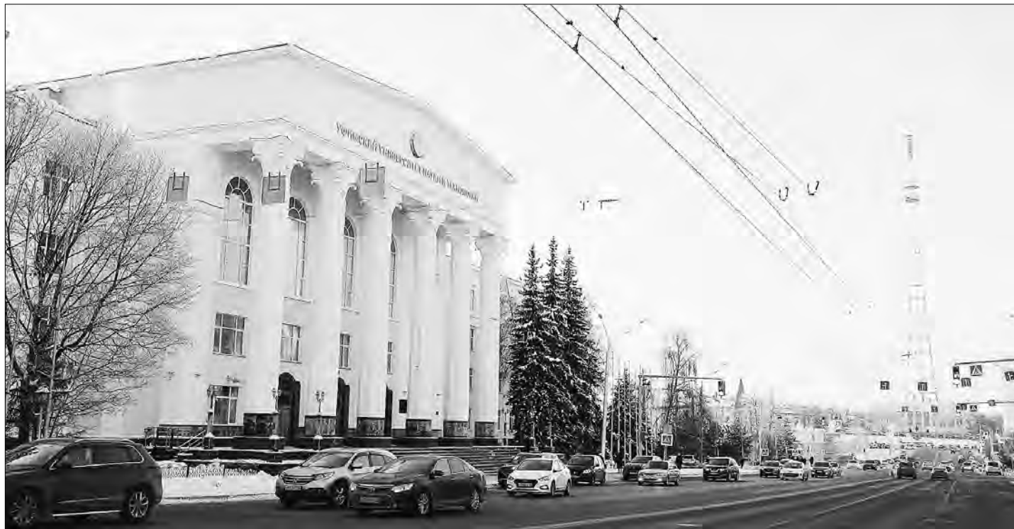
Главный корпус БГУ и здание телецентра в Уфе, построенные во второй половине 1950-х годов. — из тех объектов, которые сегодня принято называть юбилейными.

— У вас за плечами, насколько известно, большой опыт такой деятельности. — Да, я больше 20 лет занимал должность заместителя директора Центрального государственного архива общественных объединений Башкирии. Так что, действительно, значительная часть моей жизни связана именно с архивными делом. Издал несколько книг, посвященных Героям Советского Союза, Героям Социалистического Труда и другим выдающимся уроженцам республики, отличившимся на боевом и трудовом фронте. С учетом этих обстоятельств меня и пригласили заниматься составлением «Свода». Обычно на первом этапе просматриваю до трех тысяч дел, это 15–20 тысяч документов. В дальнейшем идет их коллегиальное обсуждение, остается, на наш взгляд, самое важное.