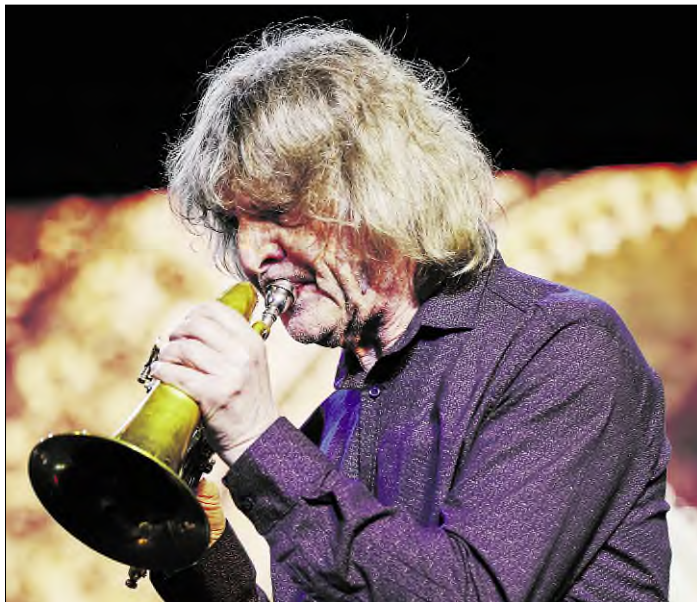
Всемирно известный импровизатор играет на разных инструментах в различных стилях и жанрах.