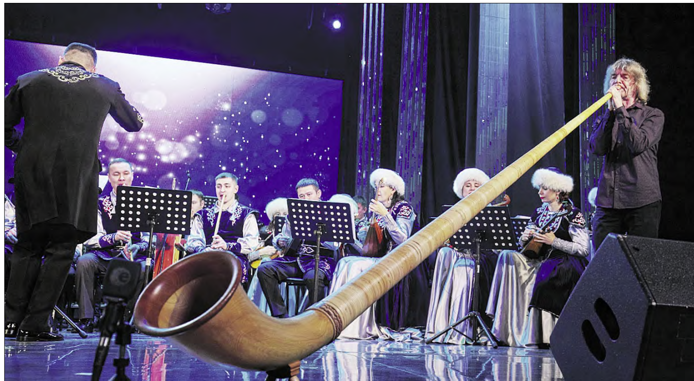
В руках виртуоза эта машина способна исполнить даже джаз.

Одним ранним утром жители Сиднея рядом с оперой, прославившей своей эпической крышей в виде огромных парусов, услышали будто бы нисходящие откуда-то с небес необычные мелодичные звуки. Если присмотреться, можно было увидеть их источник: на пике одного из парусов была видна маленькая фигурка человека, игравшего на каком-то странном вытянутом духовом инструменте, в несколько раз превышающем размеры тех, что мы знаем.