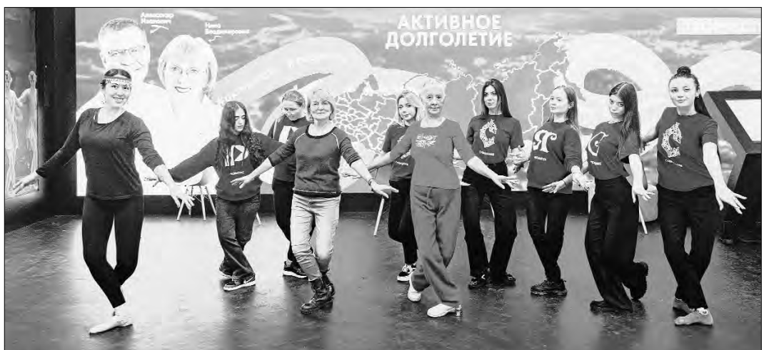
Барре-фитнес — удивительное сочетание балета и гимнастики.

Я смотрю, вы можете быть на меня похожим и говорить моим голосом (студенту СПбГУ, сгенерированному с помощью искусственного интеллекта свое изображение в образе Путина. — Авт.). Но я подумал и решил, что похожим на себя и говорить моим голосом должен только один человек — этим человеком буду я.