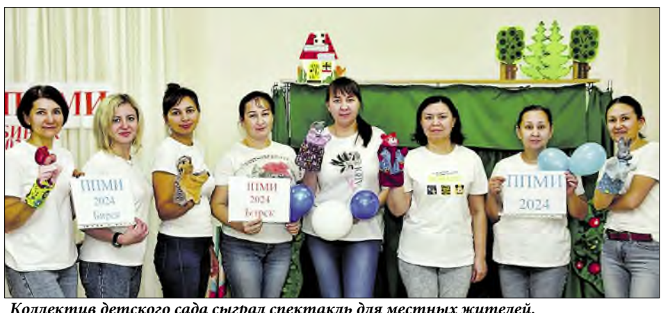
Коллектив детского сада сыграл спектакль для местных жителей. // Фото детского сада № 1 «Айгуль» г. Бирска.